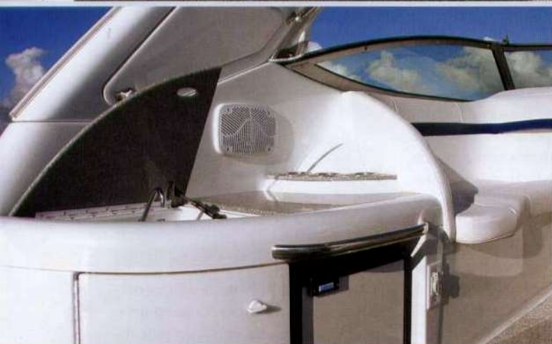
A sinistra, l'angolo bar in pozzetto. Sotto, il verricello elettrico a scomparsa.