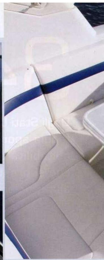
Sopra, la dinette poppiera con divano a U trasformabile in prendisole. Sotto, il cruscotto con tutti gli strumenti ben posizionati per una facile lettura.