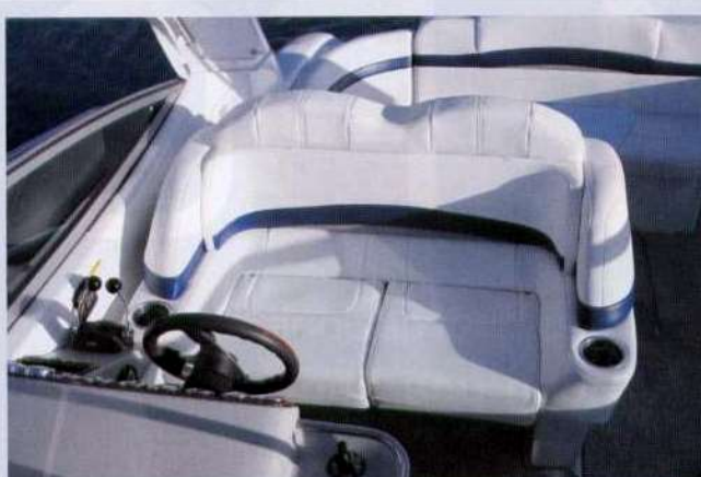
Sopra, la postazione di guida con divanetto a due posti. Sotto, di fianco alla timoneria un divano/prendisole permette di seguire la navigazione con pilota e copilota.