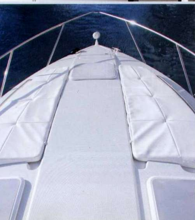
A sinistra, la tuga prodiera è attrezzata con due cuscini prendisole ai lati del passaggio centrale. Sotto, da notare la solida battagliola che protegge i gradini che dal pozzetto portano fino alla apertura centrale del parabrezza.